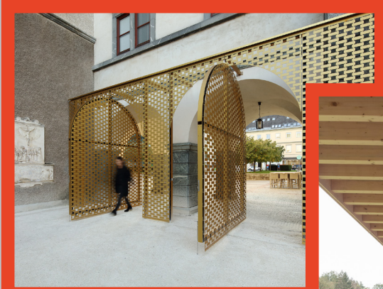
»Paradies am Dom«

Bio-Urnenfriedhof »Paradies am Dom«, Klagenfurt Bauherr:in: Dompfarre Klagenfurt Architektur: ABEL und ABEL Architektur ZT GmbH Freiraumplanung: DI Karin Walch - Walch Landschaftsarchitektur